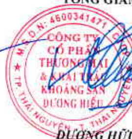
DUYNG HỮU HIẾU